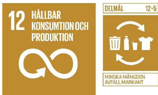
Figur 3. Mål 12 med delmålet 12.5 – Globala målen för hållbar utveckling i Agenda 2030.

Bygg- och rivningsavfall är ett viktigt område då det uppkommer stora mängder bygg- och rivningsavfall och dessa har stor miljö- och klimatpåverkan. Det saknas dock uppgifter på mängd byggavfall i Dalarna.