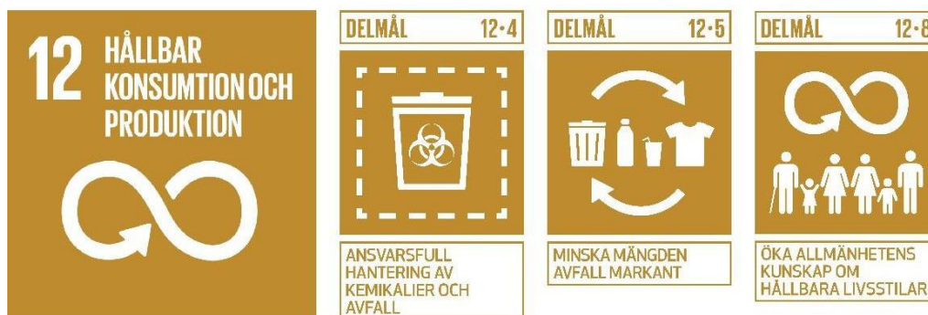
Figur 3. Mål 12 med delmålen 12.4, 12.5 och 12.8 – Globala målen för hållbar utveckling i Agenda 2030.