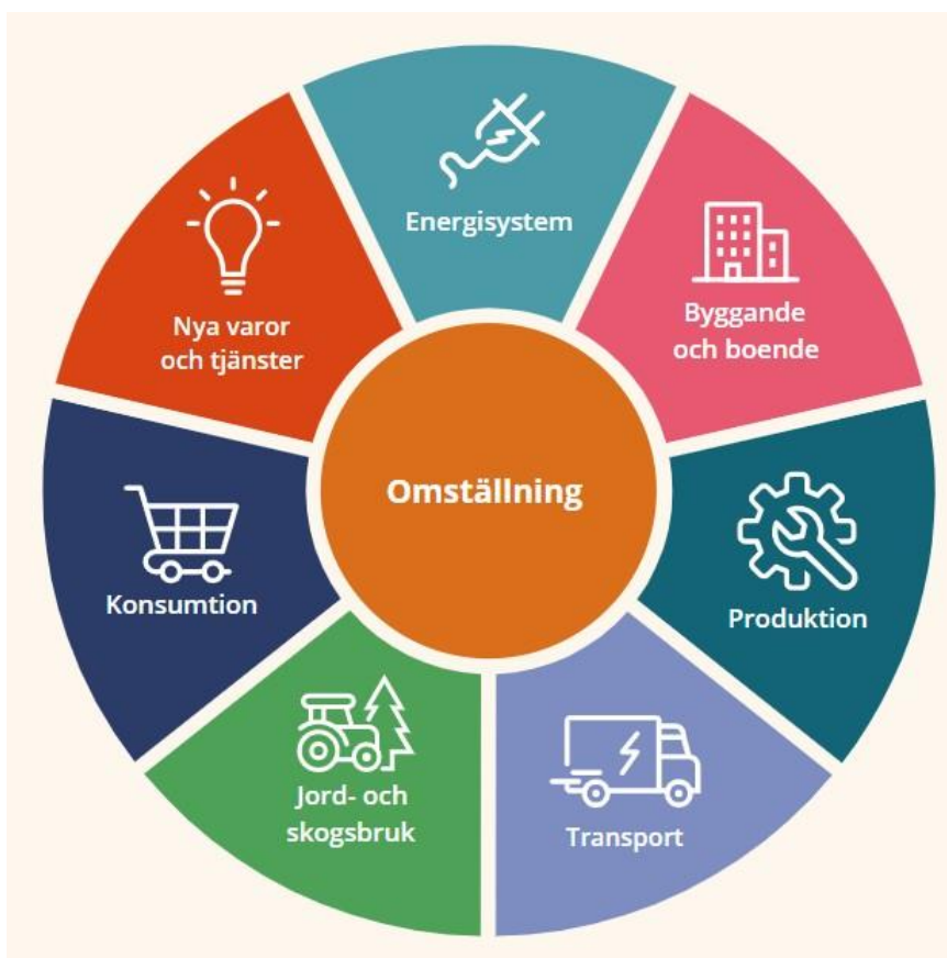
Figur 4. Energiintelligent Dalarnas strategi med sju olika områden för att bidra till att nå målet om ett energiintelligent och klimatsmart Dalarna 2045.

För detta ändamål kopplas kretsloppsplanens genomförande till det löpande arbetet i Energiintelligent Dalarna där mycket av länets strategiska arbete kring hållbarhet och resurshushållning drivs. Det gäller bland annat områdena konsumtion, byggande och boende, transporter, energisystem samt nya varor och tjänster.