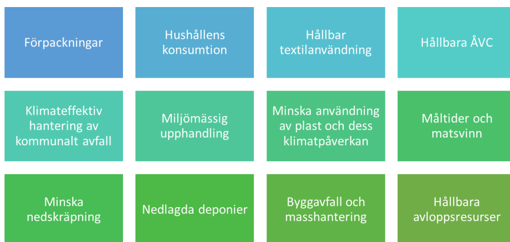
Figur 2. De tolv temagrupperna som har fokuserat på olika områden med koppling till kretslopp och cirkulär ekonomi.

Under 2022–2023 har 15 seminarier och webinarier hållits med över 700 deltagare. Temagrupperna har haft en viktig funktion genom att höja kunskapsgrunden för vad som kan göras inom respektive område. De utgör också en grund för genomförandet, då flertalet av dem avses vara kvar under genomförandeperioden (vissa temagrupper kan komma att slås ihop).