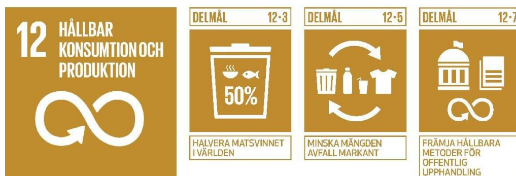
Figur 2. Mål 12 med delmålen 12.3, 12.5 och 12.7 – Globala målen för hållbar utveckling i Agenda 2030.

Internt inom kommunens verksamheter uppstår det både kommunalt avfall och verksamhetsavfall. Det saknas uppgifter om avfallsmängder från kommunala verksamheter. Klimatnyttan och ekonomiska synergier bedöms ändå bli betydande om mängden avfall minskar då kostnaderna för insamling och behandling är höga och kommer sannolikt att stiga. Kommunala verksamheter omfattas också av kraven på insamling av förpackningar och obligatorisk insamling av matavfall från 2024.