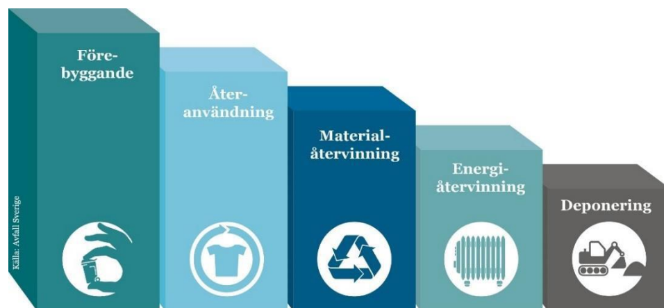
Figur 1. Avfallstrappan anger prioritetsordning för hur avfall ska hanteras.

De kommunala kretsloppsplanerna är centrala för att nå ett mer resurseffektivt och cirkulärt Dalarna!