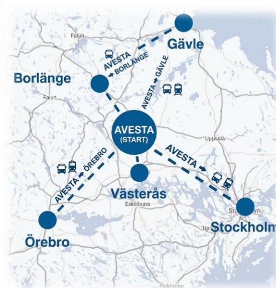
Karta som visar Avesta och närheten till Västerås, Borlänge, Gävle, Örebro och Stockholm