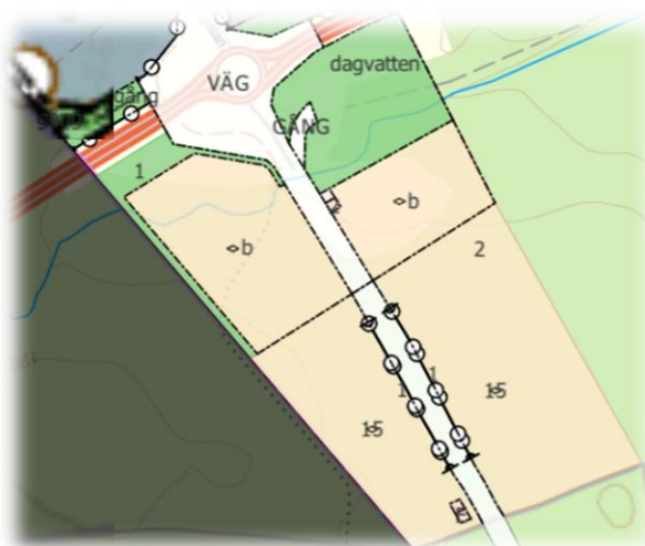
Karta över verksamhetsområdet

Båda detaljplanerna medger en högsta byggnadshöjd om 15 meter.