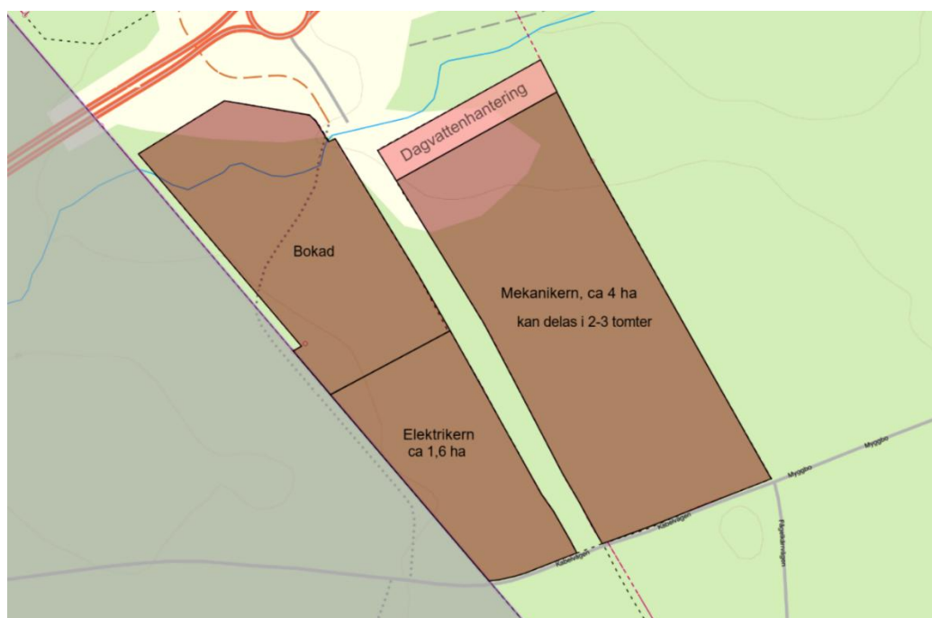
Karta över verksamhetsområdet

Utformning och byggprocess ska beakta Avesta kommuns hållbarhetsprogram.