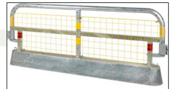
Skyddsräcke typ trafikbalk kan användas efter riskbedömning